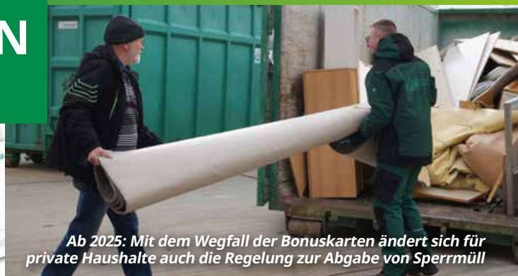
Ab 2025: Mit dem Wegfall der Bonuskarten ändert sich für private Haushalte auch die Regelung zur Abgabe von Sperrmüll

Der Kalendervordruck und die Tonnenaufkleber entfallen . Weiterhin wird die Broschüre keine Bonuskarten mehr bereithalten. Ab dem 01.01.2025 ist vorgesehen, dass für die bisherige begrenzte, gebührenfreie Abgabe von Sperrmüll durch private Haushalte keine Bonuskarten mehr erforderlich werden. Alternativ ist auf den Wertstoffhöfen und dem Umladeplatz Nißma die Abgabe eines Freikontingents pro Anlieferung für Haushalte geplant . Die Beschaffung eines Abfallratgebers, nur um die Bonuskarten zu erhalten, ist somit nicht notwendig.