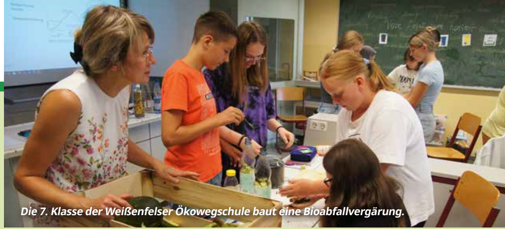
Die 7. Klasse der Weißenfelder Ökowschule baut eine Bioabfallvergärung.

Dann haben wir uns gefragt: Was passiert mit dem Abfall, den wir nicht vermeiden können? Ihr habt gut aufgepasst, als wir darüber gesprochen haben, wie wichtig die richtige Abfalltrennung ist. Ihr wisst jetzt, dass nur ordentlich getrennter Abfall verwertet werden kann. Danach haben wir herausgefunden, wie aus altem Papier, Tetrapacks oder Dosen neue Dinge entstehen können – das war ganz schön spannend, oder? In Gedanken sind wir auch zur Deponie Nißma gereist. Dort haben wir gesehen, was mit dem Abfall passiert, der nicht verwertet wird. Ihr wart sicher genauso überrascht wie ich, als wir über den großen Berg aus Abfall gesprochen haben. Plötzlich war uns klar, warum es so wichtig ist, so wenig Abfall wie möglich zu machen. Diese Berge sollen nicht noch größer werden. Und zum Schluss haben wir ein richtig cooles Experiment gemacht. Wisst ihr noch? Wir haben einen kleinen Bioabfallreaktor gebaut! Dafür brauchten wir ganz viel Bioabfall. Den haben wir in Flaschen gestopft und mit Wasser aufgefüllt. Es war so aufregend zu sehen, wie sich die Luftballons auf den Flaschen nach einer Weile mit Gas gefüllt haben.