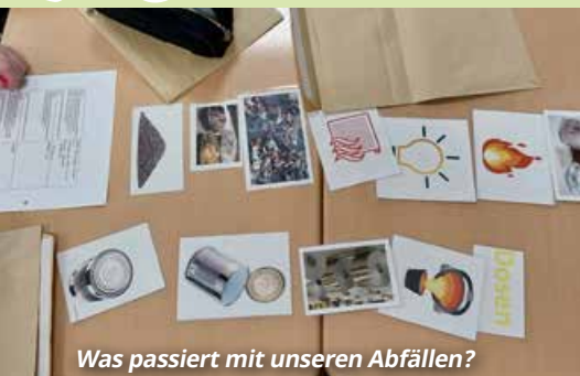
Was passiert mit unseren Abfällen?