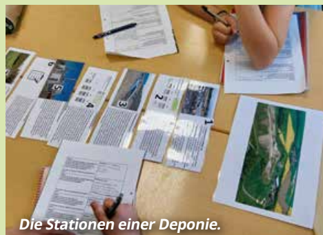
Die Stationen einer Deponie.

Dann haben wir uns gefragt: Was passiert mit dem Abfall, den wir nicht vermeiden können? Ihr habt gut aufgepasst, als wir darüber gesprochen haben, wie wichtig die richtige Abfalltrennung ist. Ihr wisst jetzt, dass nur ordentlich getrennter Abfall verwertet werden kann. Danach haben wir herausgefunden, wie aus altem Papier, Tetrapacks oder Dosen neue Dinge entstehen können – das war ganz schön spannend, oder? In Gedanken sind wir auch zur Deponie Nißma gereist. Dort haben wir gesehen, was mit dem Abfall passiert, der nicht verwertet wird. Ihr wart sicher genauso überrascht wie ich, als wir über den großen Berg aus Abfall gesprochen haben. Plötzlich war uns klar, warum es so wichtig ist, so wenig Abfall wie möglich zu machen. Diese Berge sollen nicht noch größer werden. Und zum Schluss haben wir ein richtig cooles Experiment gemacht. Wisst ihr noch? Wir haben einen kleinen Bioabfallreaktor gebaut! Dafür brauchten wir ganz viel Bioabfall. Den haben wir in Flaschen gestopft und mit Wasser aufgefüllt. Es war so aufregend zu sehen, wie sich die Luftballons auf den Flaschen nach einer Weile mit Gas gefüllt haben.