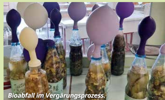
Bioabfall im Vergärungsprozess.

Die Dauer des Workshops ist individuell anpassbar. Die Verbindung des Angebots mit einem Projekttag oder einer Exkursion ist möglich, wesentliche Materialien und Präsentationstechnik werden gestellt. Das Angebot ist für die Schulen kostenlos.